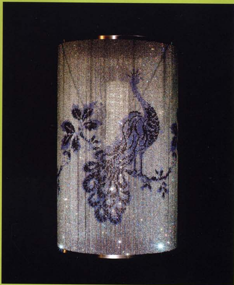
Pixelated Peacock voor Swarovski