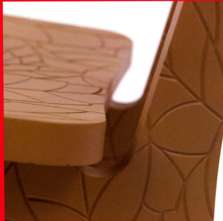
Jolly Jubilee voor Arco

met de grandeur van een kroonluchter, ontwierp ze een pauw die opgebouwd is uit drie kleuren pixels. Elke pixel werd een Swarovski-kristal.