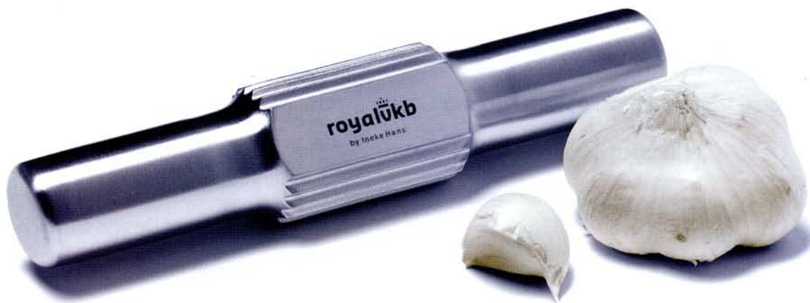
Knoflookpers voor Royal VKB