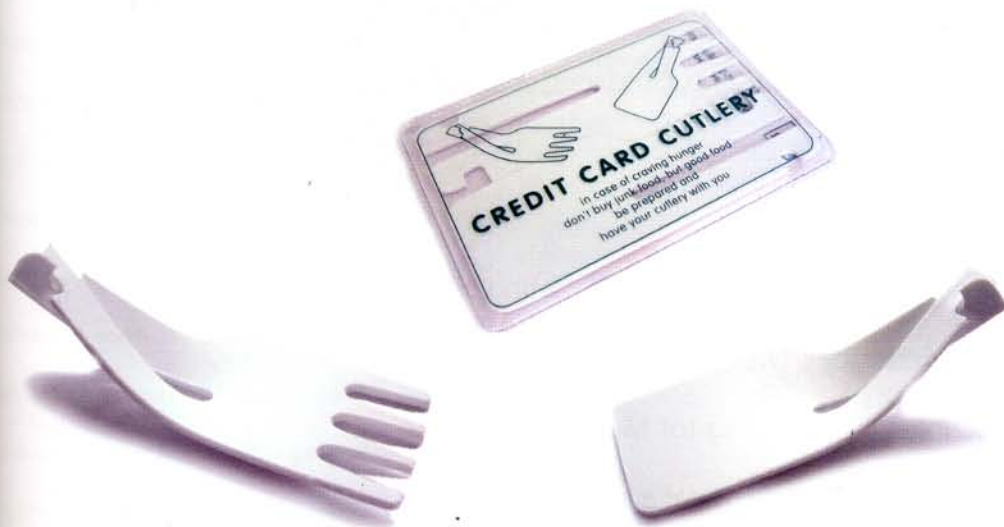
Credit Card Cutlery voor Cooper-Hewitt museum, New York